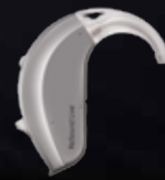
Kraft BTE, nýtt